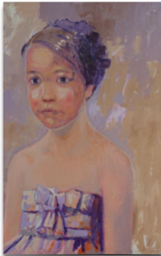
"BIMBA" Tecnica mista con acrilico su tela, 72 X 62