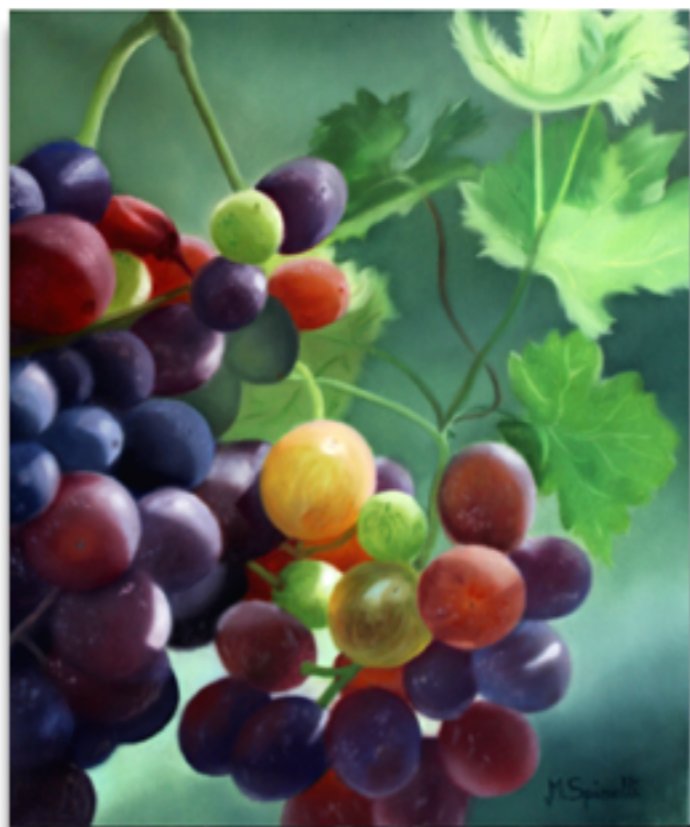
"PRIMA O POI" Olio su tela, 60 X50