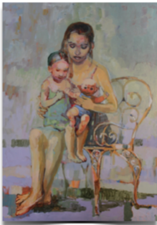
"COCCOLE" Tecnica mista con acrilico su tela, 90 X 65