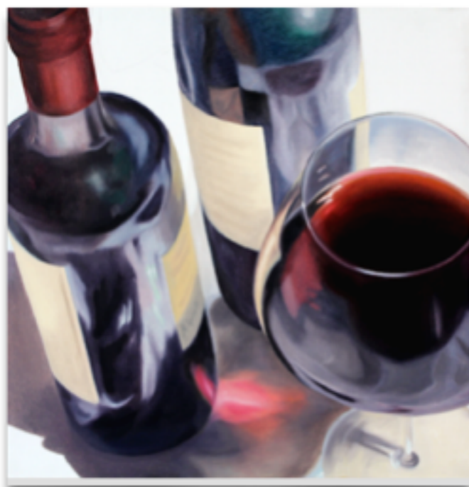
"RIFLESSI" Olio su tela, 60 X 60