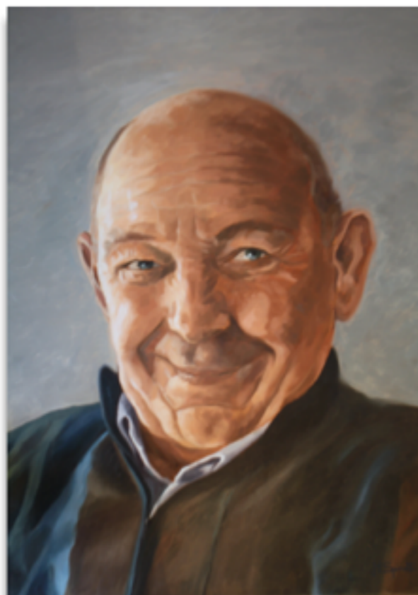
NONNO MARIO Olio su tela, 60 x 80 Marisa Spinelli