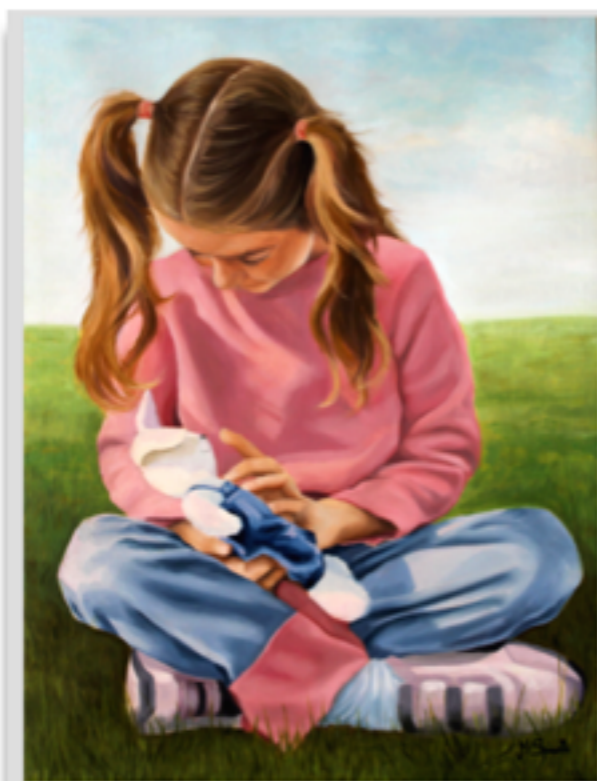
"GIOCHI DI BIMBA" Olio su tela, 80 X 60