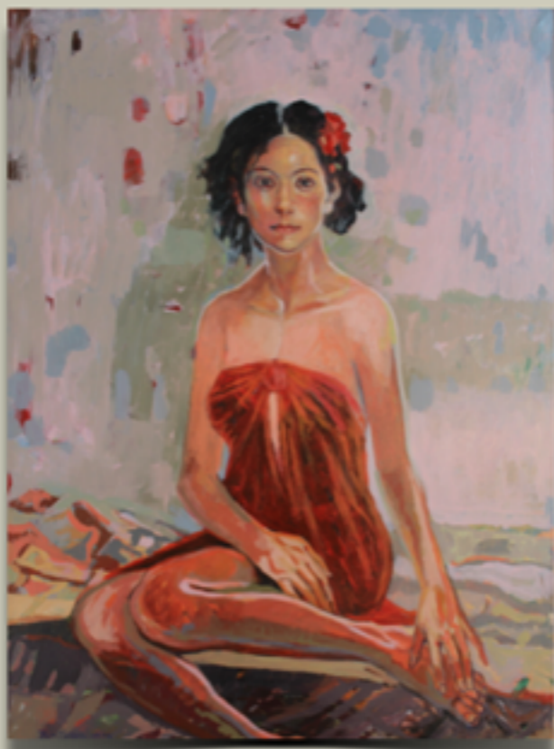
"ULTIMI RITOCCHI" Tecnica mista con acrilico su tela, 100 X 80