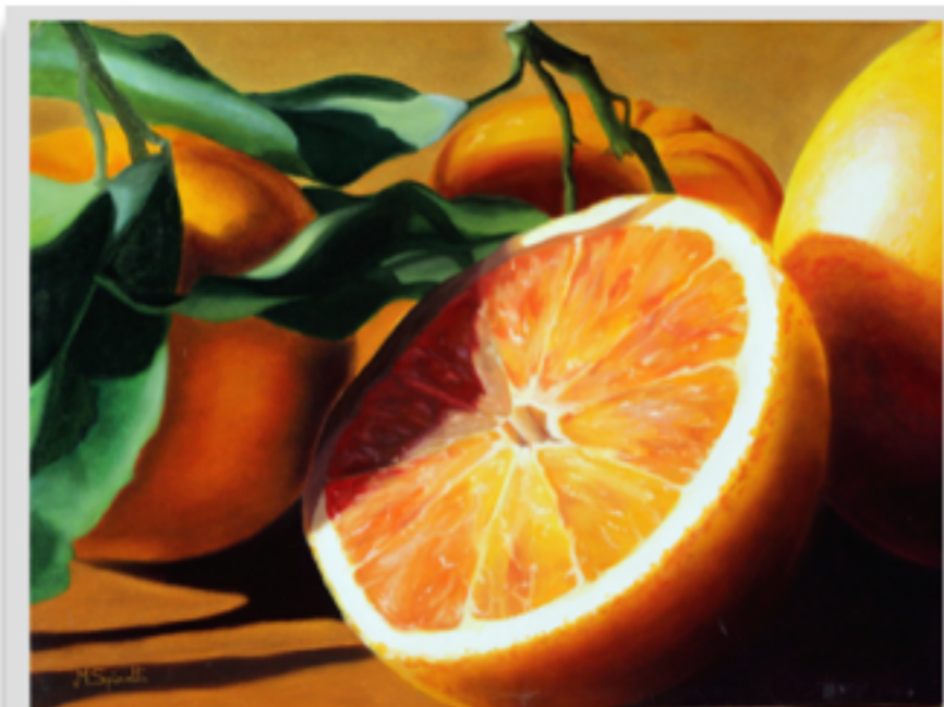
"SPREMUTA DI SOLE" Olio su tela, 60 X 80