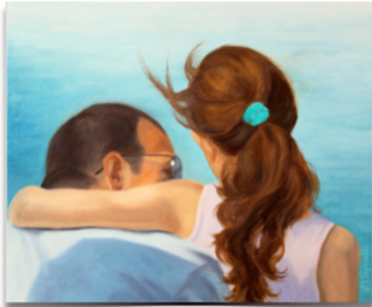
"SEGRETI" Olio su tela, 50 X 60

11 NOVEMBRE 2014 25 NOVEMBRE 2 DICEMBRE 16 DICEMBRE 13 GENNAIO 2015 27 GENNAIO 10 FEBBRAIO 24 FEBBRAIO 10 MARZO 24 MARZO 14 APRILE 28 APRILE 12 MAGGIO 26 MAGGIO