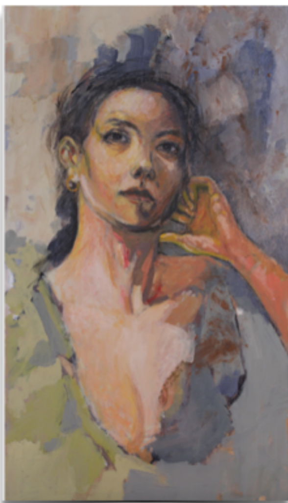
"ASSORTA" Tecnica mista olio su tavola, 84 X 48