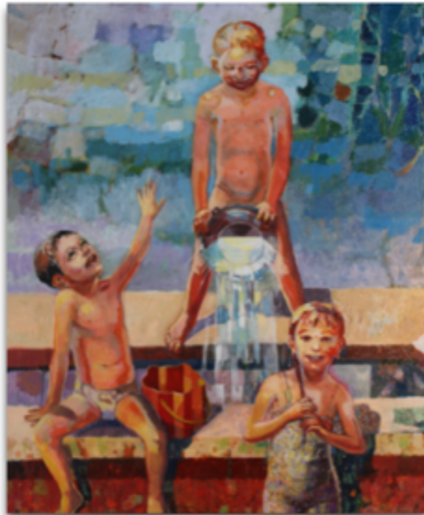
"GIOCHI D'ACQUA" Tecnica mista con acrilico su tela, 100 X 80