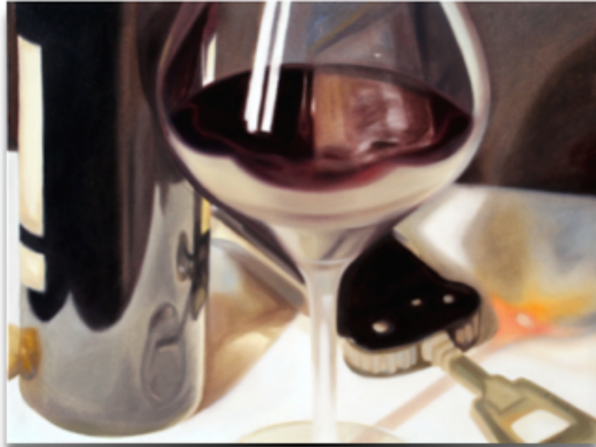
"SULLA TAVOLA" Olio su tela, 60 X 80