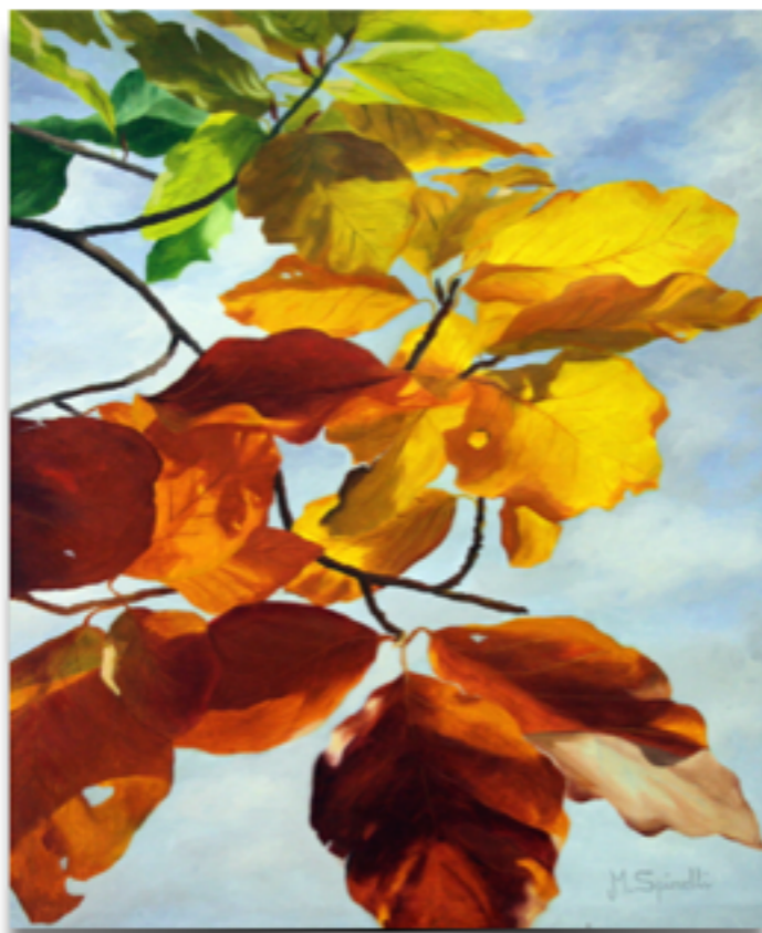
"METAFORA DELLA VITA" Olio su tela, 60 X 50