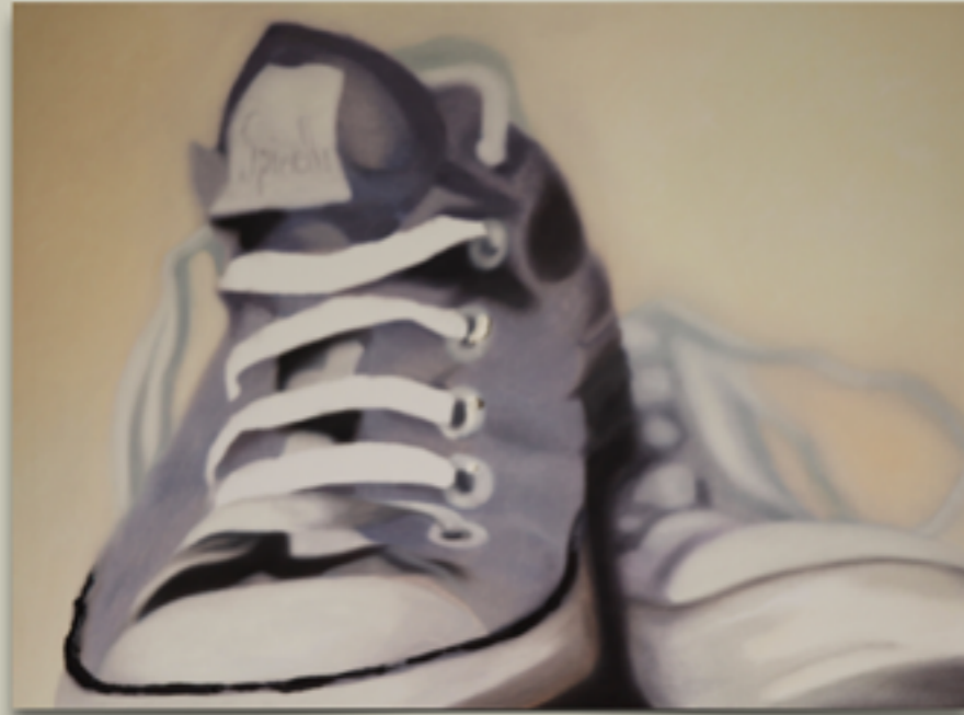
"ADOLESCENZA" Olio su tela, 60 X 80