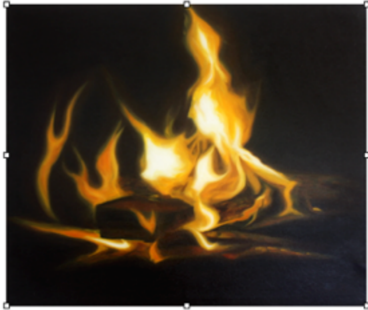
"FOCOLARE" Olio su tela, 50 X 60