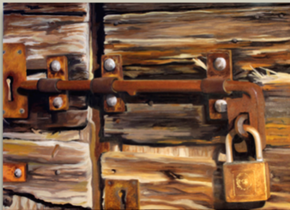
"CATENACCIO" Olio su tela, 50x70