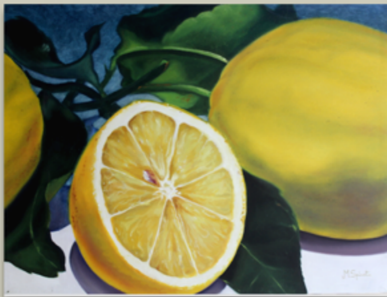
"GRANITA" Olio su tela, 60 X 80