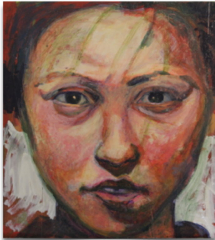
" INCREDULITA' " Tecnica mista olio su tavola, 37 X 33 Rino Merzari