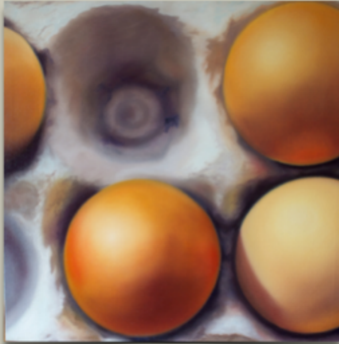
"FRAGILE" Olio su tela, 60 X 60