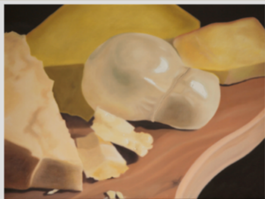
"FORMAGGI" Olio su tela, 60 X 80