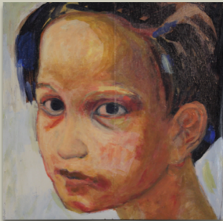
"CIUFFO BLU" Tecnica mista olio su tavola, 32 X 33